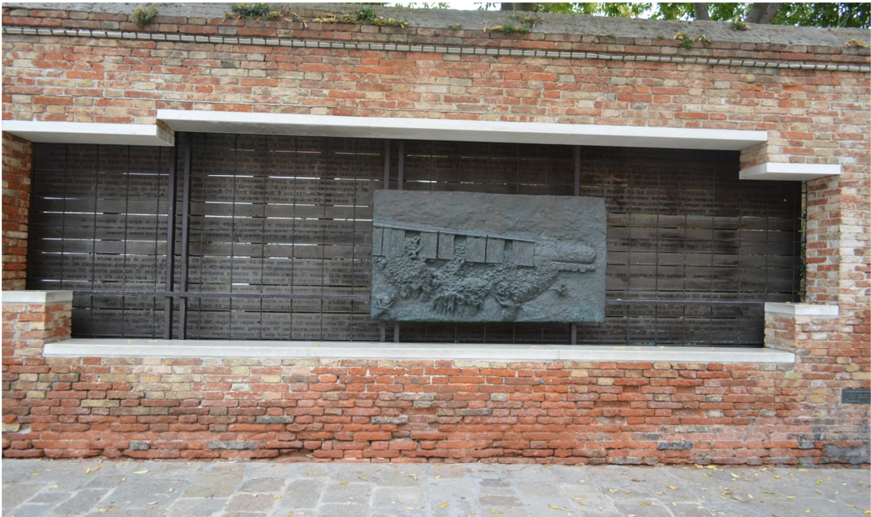
Venecia, Italia. Antiguo gueto judío del siglo XVI. Cannaregio. Plaza central del Gueto, Campo del Ghetto Nuovo. Memorial poema de André Tronc. A las víctimas de la deportación de los judíos en la Segunda Guerra Mundial.